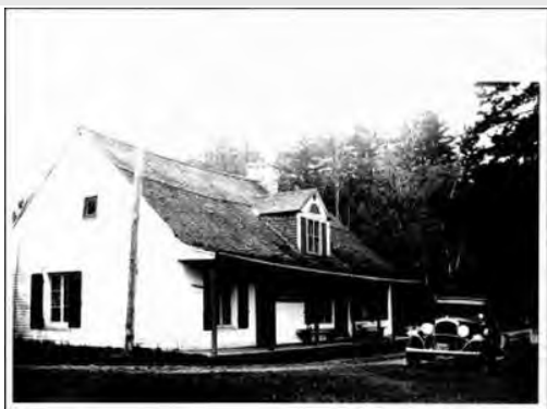
Maison Déry-01, 20e siècle