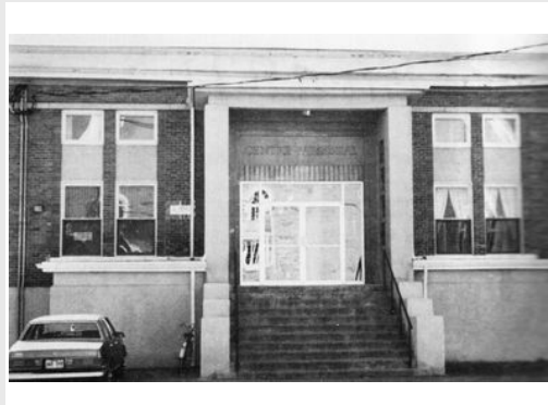
Centre paroissial, v1992