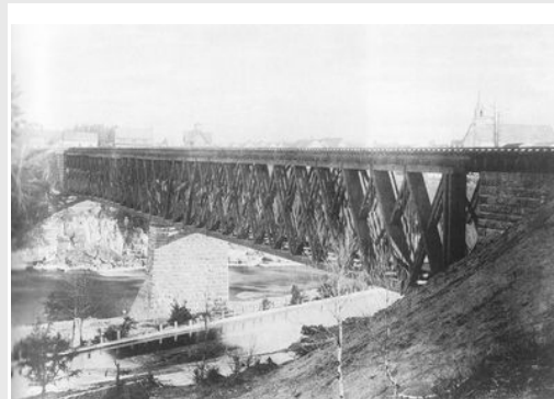
Pont du chemin de fer, vers 1880