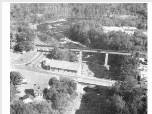
Pont du village, 1992