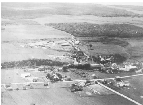
Vue aérienne sur Saint-Charles et usine Bishop