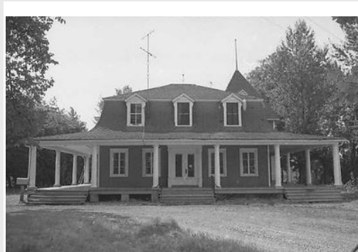
Maison Bishop-1, 1977