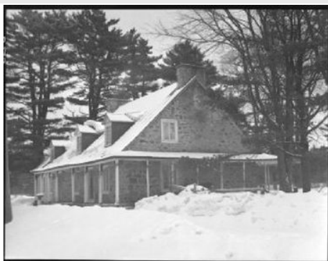
Maison John-Smith, 1942