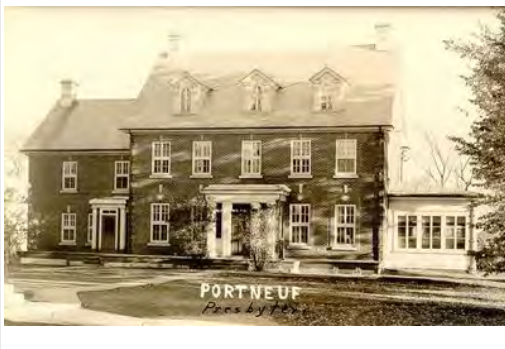
Presbytère de Portneuf-2