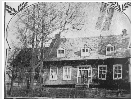
Premier presbytère, début 20e s