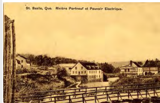
Moulin F-X Piché