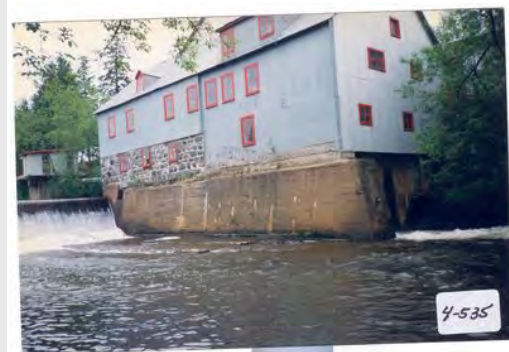
Moulin FX Piché-05, vers 1980-1990