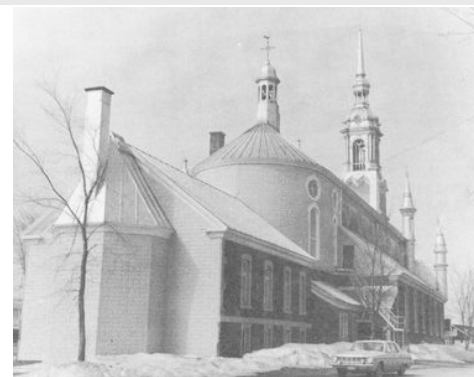
Église de Saint-Basile-2