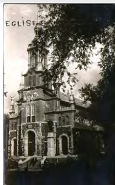
Église de Saint-Basile-4