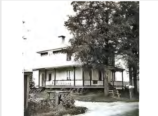
355 rang St-Joseph